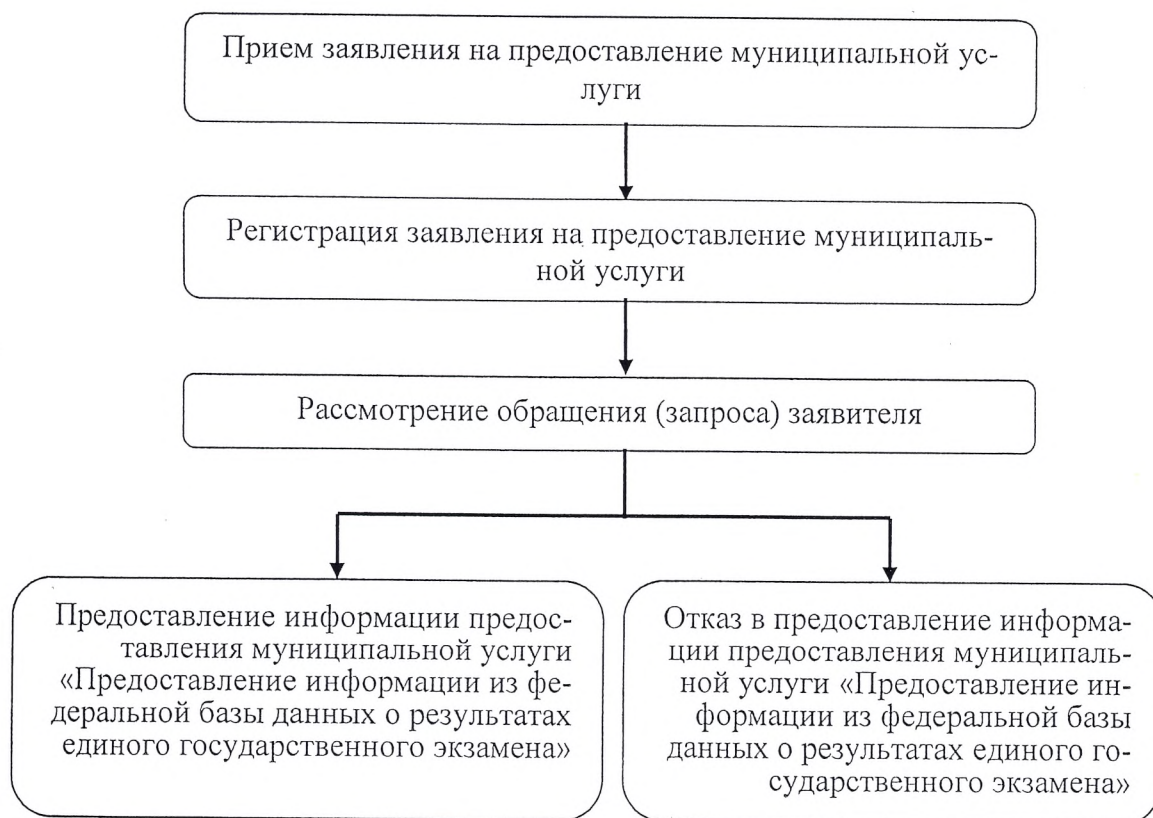
Блок-схема последовательности административных процедур